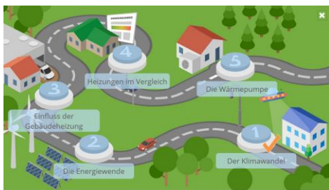
Abb.: Beispiel Hauptmenü in Modul 1 (Kapitel 1 abgeschlossen)

Vollständig bearbeitete Kapitel werden durch einen Haken gekennzeichnet.